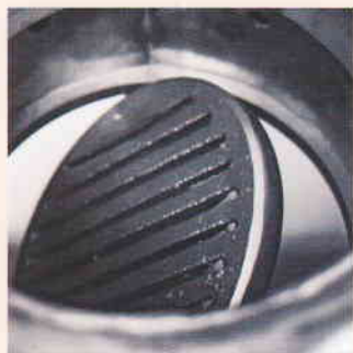
Автоматско самочистачко, ротирачко ложиште

Водечки сегмент согласно трендовите за користење на обновливи извори на енергија е програмата за котли на пелети каде има воведено најнапредни технологии, а една од најзначајните е секако технологијата за самочистење.