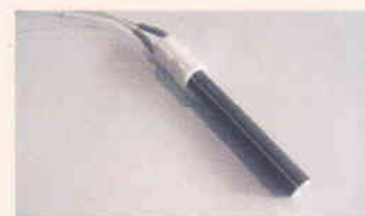
Керамички грејач за брзо палење и долгорочна употреба