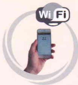
Апликација за телефон (опционално)