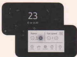
Мултифункционален дисплеј на допир